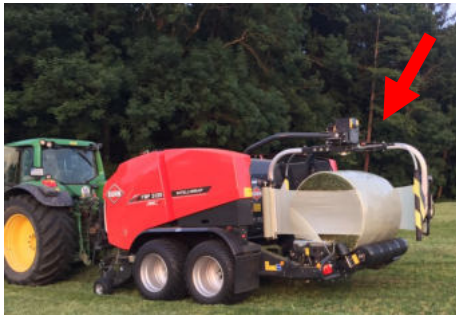
Siloballen OHNE Netz

Berger Str. 6 D-83549 Eiselfing Tel.08071/3131 Fax 08071/40533