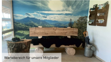
Wartebereich für unsere Mitglieder

In dieser Zeit haben wir uns bereits gut eingelebt. Auch von unseren Mitgliedern kamen bisher nur positive Rückmeldungen - was uns natürlich sehr freut. Die Parksituation hat sich mehr als gebessert (man kann sogar mit dem Bulldog gut vor der Haustür parken ;-)) und auch optisch kommt die Geschäftsstelle sehr gut an.